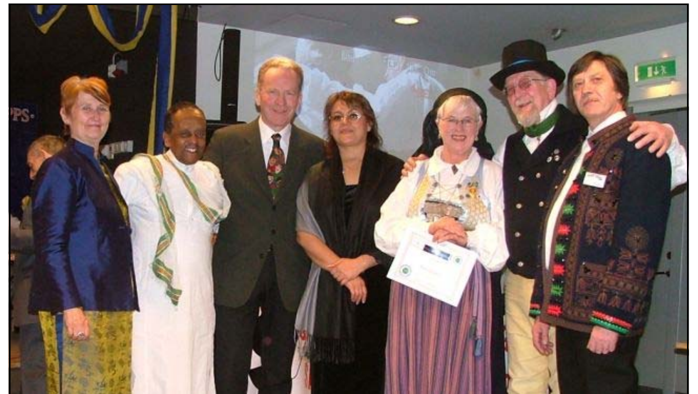
Kulturbalen i Lund var ett lyckat arrangemang. Bilden ovan visar en del av ledningen. Artikeln finns på sidan 2.