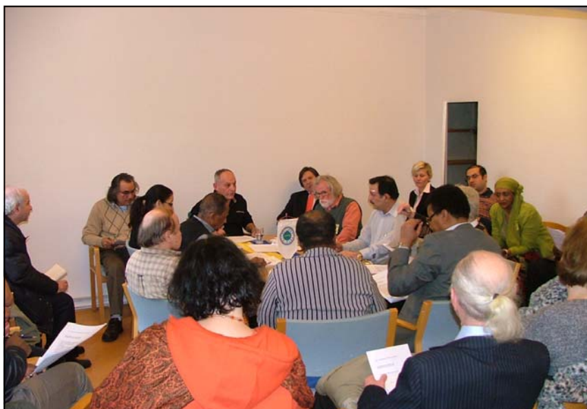
Verksamhetsberättelsen visar att LIFS har haft fullt med aktiviteter under året som gått. Nu ser vi fram mot 2009.

Vi vill starta opinionsbildning och hitta en tillvägagångsprocess för etableringen av en integrations-