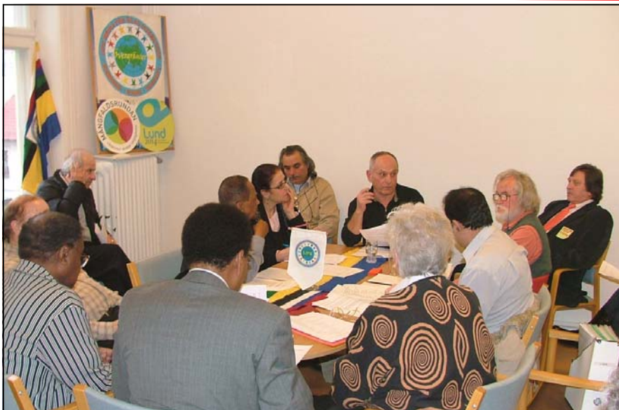
Söndagen den 15 mars hölls LIFS årsmöte. Det var också första gången som vi använde den tredje våningen som vi precis fått tillgång till i LIFS befintliga lokaler på Stora Gråbrödersgatan.