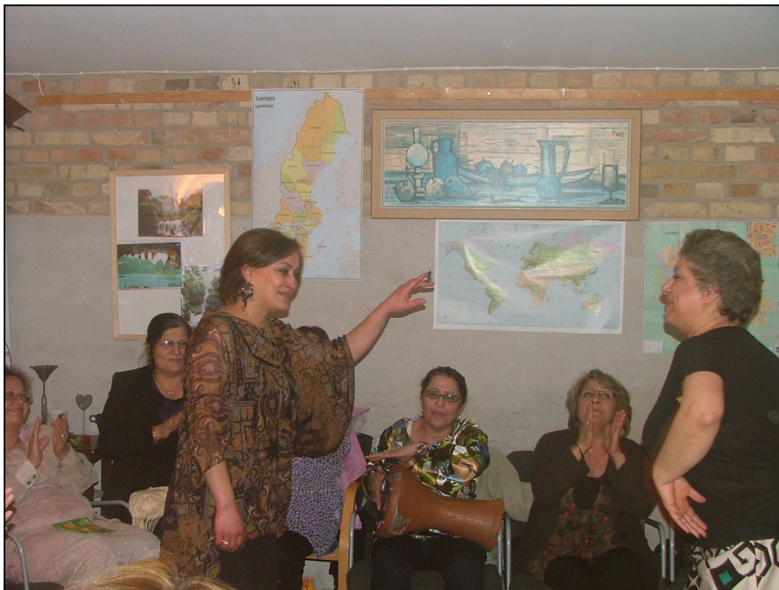
När Irakiska Kvinnoföreningen i Lund firar 8 mars är det dans och musik, men också allvar. I hemlandet Irak är kvinnornas situation mycket svår.

Internationella kvinnodagen, 8 mars, har firats på olika håll i världen. Även medlemsföreningar i LIFS har uppmärksammat dagen. Irakiska kvinnoförbundet samlade kvinnor från Lund och andra delar av Skåne.