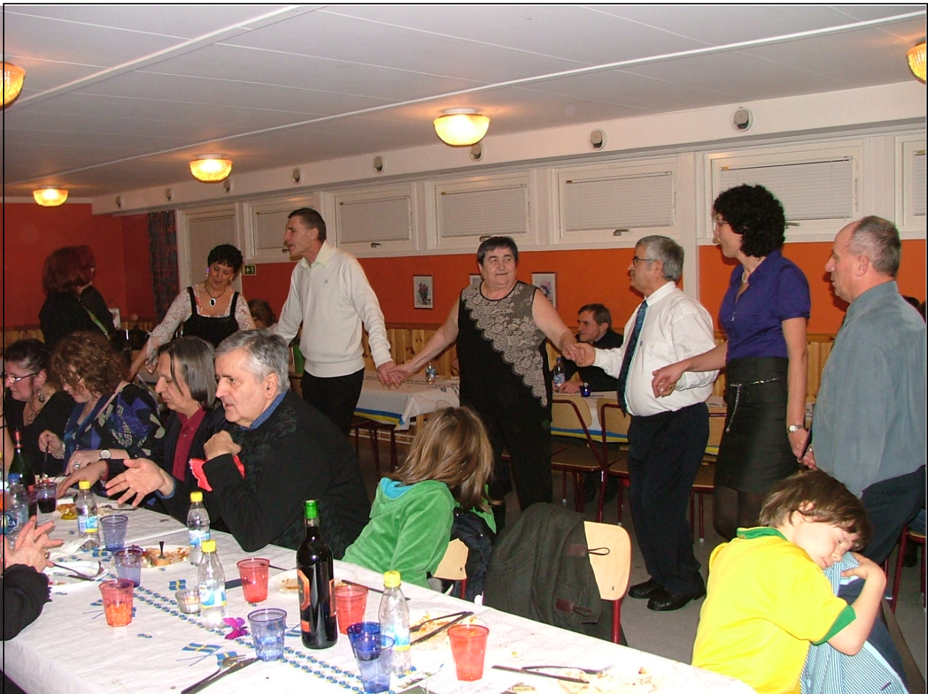
Jugoslavisk-Svenska förening Jedinstvo-Enighet firar internationella kvinnodagen med mat, glädje och traditionell folkdans.

mycket moderna. Ibland till och med modernare än här, säger hon och syftar på bland annat mode och kläder.